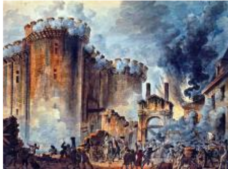
14. Juli 1789 Sturm auf die Bastille

• Nennen Sie vier Gründe , die 1789 zur Revolution führten: